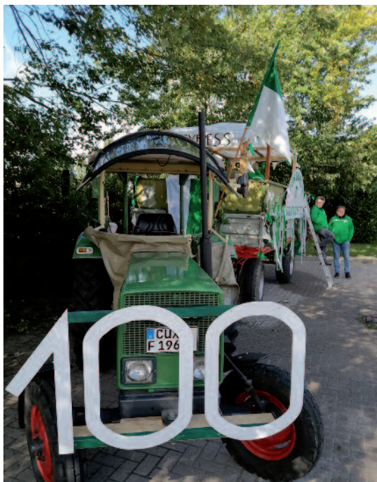
Der Trecker ist fertig.

Da Padingbüttel ja eigentlich keine richtige geschlossene Ortschaft ist, sich die Häuser