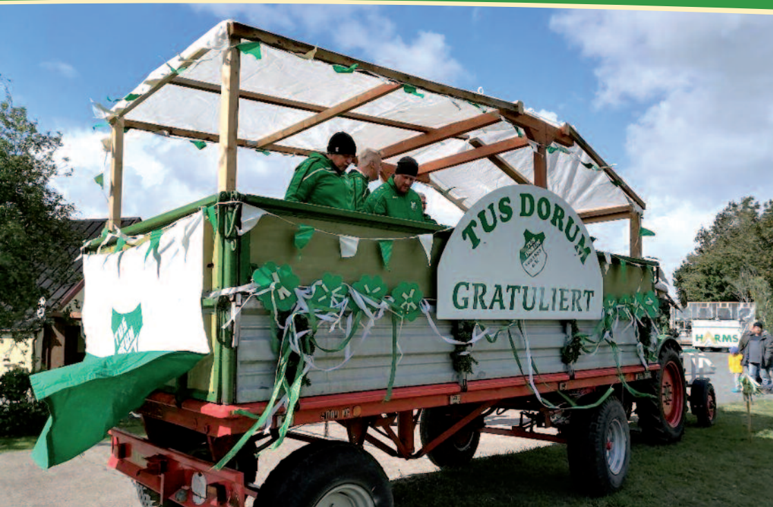
Der TuS grüßt den TSV

Nun wurde noch das nötigste vom Anhänger abgeladen und es ging nach Hause...erstmal trocken.