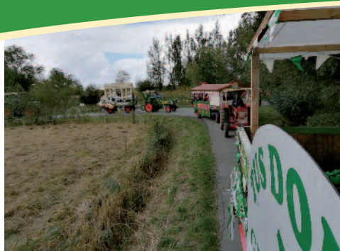
Der Umzug Bratwurst wird verschenkt