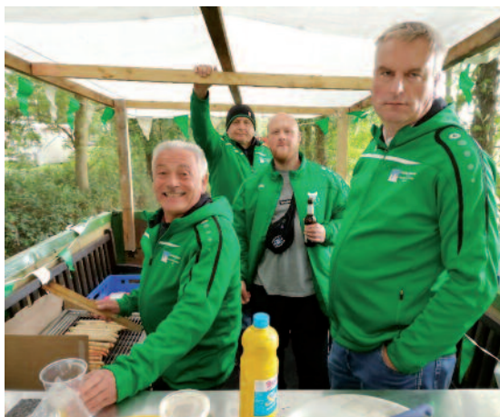
Gute Stimmung auf dem Anhänger